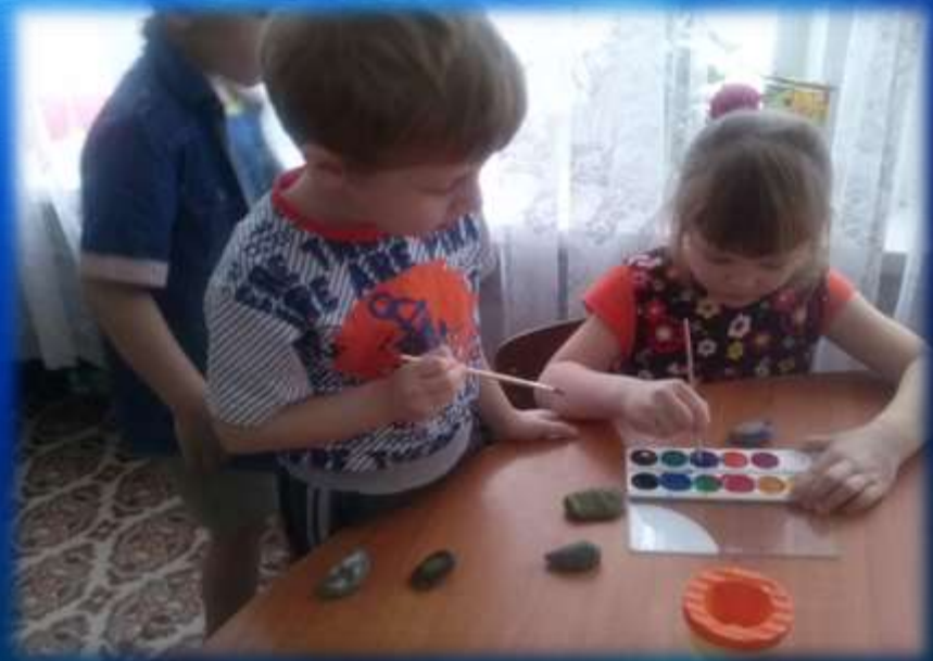
Роспись на камне «Рыбка»