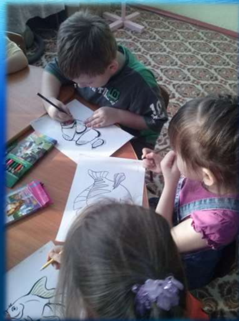
Раскрашивание раскрасок «Рыбы»