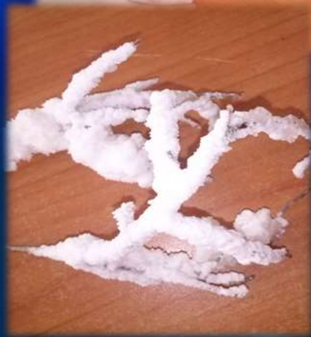
Экспериментирование «Наращивание кораллов» (кристаллизация соли)