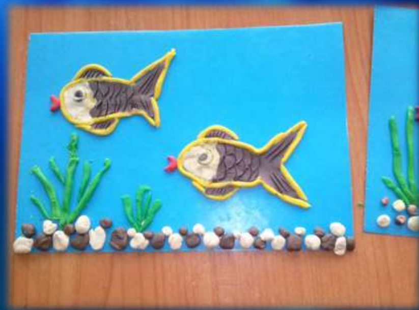
Аппликация «На дне морском»